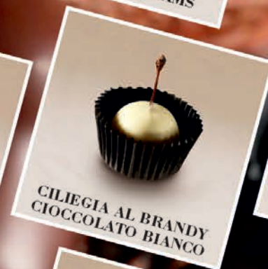
CILIEGIA AL BRANDY CIOCCOLATO BIANCO