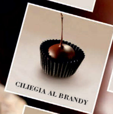
CILIEGIA AL BRANDY